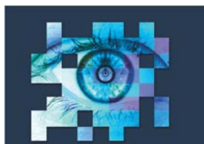
Trophée de la Sécurité Privée

EAMUS CORK GROUP / COGAN CSTG , lauréat 2010 dans la catégorie: « Meilleur service de gestion RH/Formation d'une entreprise de sécurité privée »